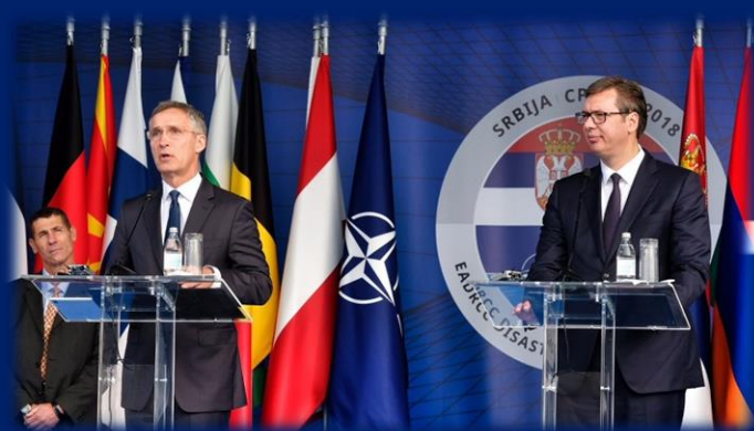
Generalni sekretar NATO-a, Jens Stoltenberg u poseti Srbiji, 20. oktobar 2018.godine