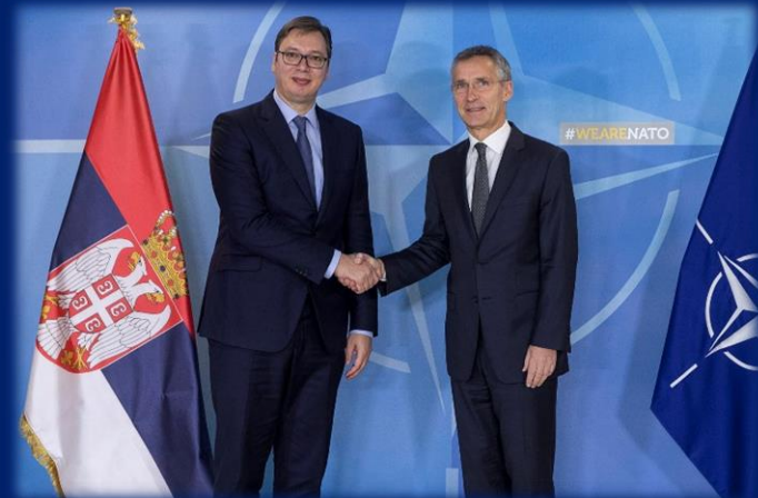
Predsednik Srbije Aleksandar Vučić i generalni sekretar NATO-a, Jens Stoltenberg u sedištu NATO-a, 15 novembar 2017. godine